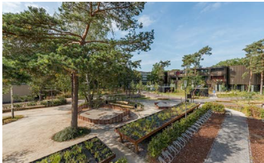
De werking van Plant-e.